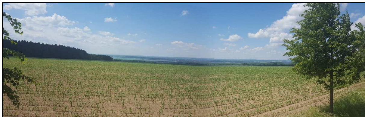
Pohled na Rozkoš od Vysokova